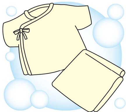
肌着のリメイクは、思い出のモノを再び使える喜びもありますね♪

どは、しまっておくと、首回りなどが黄ばんでしまうこともあります。ほかの人にあげるのも難しい場合は、深く思い出に残っているモノ3〜5着を残し、あとは処分するか、リメイクもおすすめです。四角く切って2枚重ねて縫えばハンカチとして使えますし、そのハンカチの両側にひもをつければ、よだれかけにもなります。肌に優しい素材できているので、使い勝手も良いですよ。