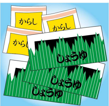
からしや醤油の小袋も、油断すると増えがちに。容量を決め、残りは料理に使うなど減らしましょう

く言われているので、サンプルをもらったときに、どれくらいの期限で使った方が良いか、店頭で確認し、日付を直接書いておくとかわりやすいですね。宿泊先のアメニティは、家族分は取っておいて、あとは、思いついて処分しましょう。