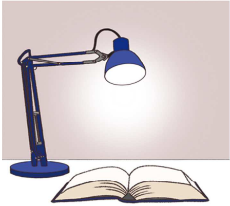
昼光色は青みがかった光でモノや字がはっきり見えるメリットがあります

ような色で、太陽光に近い、ナチュラルな光の色。洋服の色をそのまま確認できるウォークインクローゼットや、化粧をするパウダースペース、洗面所といった場所がおすすです。なお、ダイニングは、料理を温かい雰囲気で見せたり、お酒を飲みながらリラックスする場所にしたいなら、電球色を。野菜の色をそのまま鮮やかな彩りで見せたいなら、昼白色、というふうに、好みで選ぶと良いですよ。