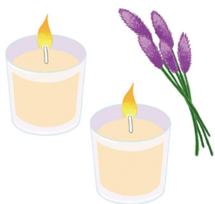
アロマキャンドルで好きな香りを楽しむのも良いですね

に照明を置き、背面の壁を照らすのもおすす。その際、熱が発生しやすい照明器具は避けましょう。 ンドルをともし時間が短いと、中心だけ溶けてしまい、その寿命が短くなるので、1時間以上灯すことで、キャンドルの表面が均等に溶けて、長く楽しめるそうです。 火が苦手な人は、LEDキャンドルの温かみのあるあかりでその雰囲気を味わうのも良いですし、アウトドアブームで人気のランタンを部屋で使うと、非日常的な雰囲気が楽しめます。