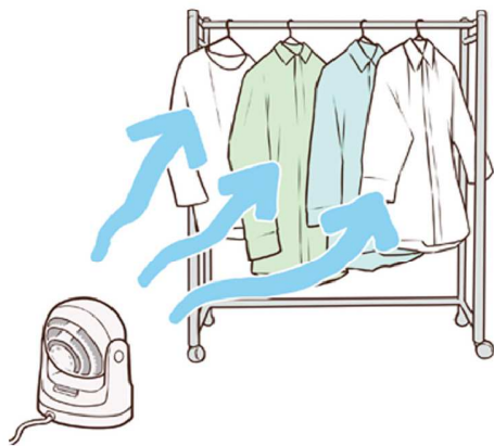
部屋干し時、扇風機やサーキュレーターも、下から上へ風を送るようにすると良いですよ。

湿気で困るのが、玄関。おうちの顔なので、清々しい雰囲気になりたいですね。靴箱を開放して湿気を追い出したり、まめに掃除するのももちろん、靴の湿気を追い出すことも大切です。同じ靴は連続で履かずに1日休ませることで、乾燥させることができますし、雨で濡れたときは、新聞紙を丸め