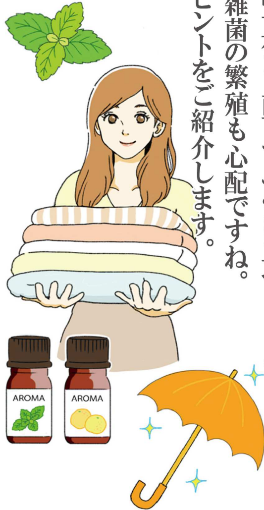
効率よく除湿するポイントです。

置く場所はズバリ、部屋の中心付近がベスト。湿った空気を吸い込んで除湿する吸気口と、乾燥した空気を出す送風口が別の面になっている仕様が多いため、端に置くと、どちらかの気流が妨げられ、効力が不十分になります。また、扇風機や、サーキュレーターを除湿器の対角に置き、併用して空気の流れをつくることで、より効果的に除湿できます。除湿する際は、部屋の窓や戸を閉めることも、