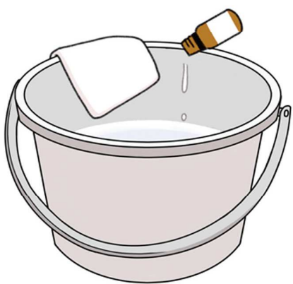
バケツの水にアロマオイルを3〜4滴たらして拭き掃除に使うのもおすすめです♪

に香りを拡散させても良いですし、ティッシュやお湯を入れたマグカップに、1〜2滴たらして嗅ぐのも良いでしょう。ちなみに、ディフューザーは水を使いますが、あくまで香りを拡散させるもので、加湿器とは違うのでご安心を。ほかに、器に重曹を入れ、アロマオイルを5〜10滴たらして玄関などに置くと、さわやかな雰囲気になりますよ。