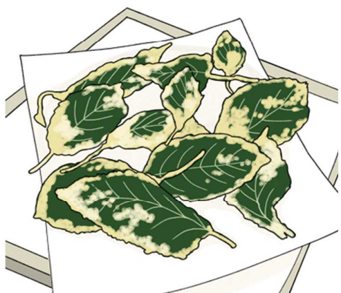
モロヘイヤの天ぷらもサクッと旨い♪生のまま、水で溶いたてんぷら粉で揚げまじょう

し、砂糖としょうゆ、すりごまと和えれば完成。鰹節を加えて混ぜると、より味わい深くなります。 ・細かくしたオクラに同じく細かく刻んだトマトやキュウリと合わせて、そうめんのトッピングにいかが？ ・細かい輪切りにして、スープに入ればちよつととろみのある仕上がり。わかめやネギと一緒にに入れて、中華風でも和風でも相性抜群です。