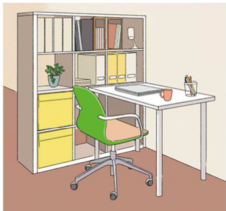
観葉植物や写真を飾るなど、好きなモノを凝縮させるのも素敵♪

省スペースでも アイテム次第で自分の域に ダイニングテーブルの一角を自分のスペースにするパターンもあります。食事以外は空いているダイニングテ