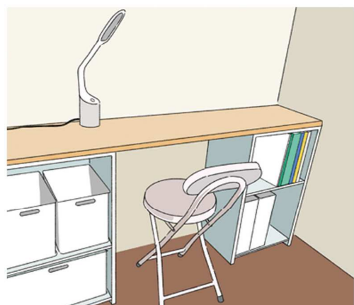
カラーボックス2つに天板を渡せば、省スペースで収納兼デスクが実現！

小さい空間でもいいから自分のスペースが欲しい！ということなら、奥行きが浅いコンソールテーブルや、壁面に設置でき、必要なときだけ使える折り畳み式のテーブル、はしご型の机などを活用するのも手です。収納と机が一体型になったライティングビューローもおすすすめ。ライティング