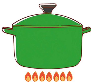
お湯を沸かすときはフタをすることで、熱が逃げるのを防ぎ、早く沸くので省エネにつながります。

料理のときに、煮込み料理は長時間火にかけなければいけません、短時間で仕上がる圧力鍋や、保温性が高い鍋を使うことも手です。保温性が