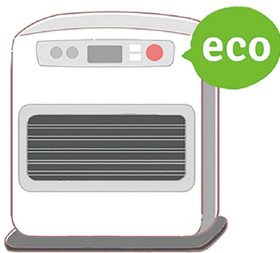
暖房器具は、暖めすぎを防ぐエコ運転などを利用するのも良いですね!

ガスファンヒーターは、フィルターを掃除することで、運転効率の低下を防ぎ、ガスの節約になります。暖房器具の設定温度を低くし、厚手のカーテンや着るものに工夫すれば節約になりますね。