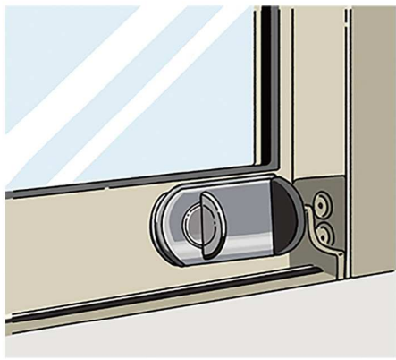
補助錠は、窓にも効果的。外から見えないモノも。ホームセンターなどでチェックしてみてください。

●玄関ドアの防犯性を高める…ディンプルキー、ウェーブキーといった、防犯性能の高い鍵に変えたり、防犯性能の高い鍵が付いた玄関ドアに変えるという手もあります。玄関ドア自体も一新できるのでおすすめです。