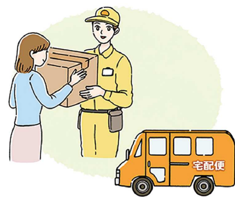
宅配便の配達員さんは決まった方が多いパターンなので、普段から覚えておいたり、部屋の窓から配達車両を確認するのも良いですね。

●宅配便にも気をつける…宅配便が来ると無意識にドアを開けてしまいがち。しかし、昨今、宅配便を装い、在宅中でも強引に侵入する事例があるので、「どちら様？」と会社名を尋ねたり、「どこからですか？」など、荷物の詳細を確かめましょう。自分や家族が、宅配便で何をオーダーしたか共有しておく、より安心です。