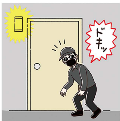
人感センサーライトや、カメラ付インターホンも、警戒心を高める心強いアイテムです。

●長時間いない場所の窓に気をつける…浴室やトイレの窓は、換気などでつい窓を開けっぱなしにすることも。部屋とは違い、人がいないことが多い場所は、長時間窓を開けておくとマクされることも。短時間の換気以外は施錠しましょう。