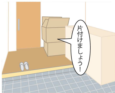
玄関ホールに宅配の荷物などのモノを放置すると、出入りの際にじゃまになり、つまずきの一因に。届いたら、すぐにモノを出して片づけましょう。

土鍋や大きな鍋など、重いモノを収納棚の上の方に置くと、出し入れの際に思わぬケガにつながる危険が。