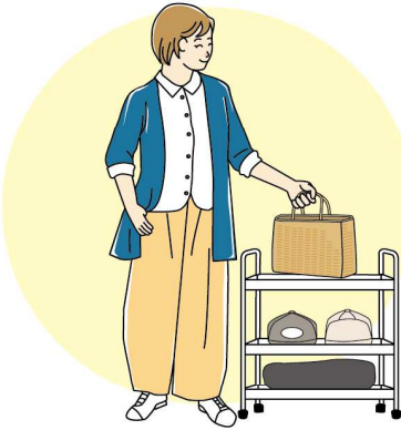
たとえば、普段使いのバッグを置くなら、腰高くらいの位置だと、ムリなく取ることができ、中身の出し入れもしやすいです。

もつまずくことがあるそう。また、座布団を踏んで足を滑らせてしまう恐れが。温かみのある雰囲気は良いですが、ラグやじゅうたん、座布団がないことで掃除がラクになり、大きな敷き物の洗濯の大変さから解放されるといったメリットも。検討の余地ありではないでしょうか？